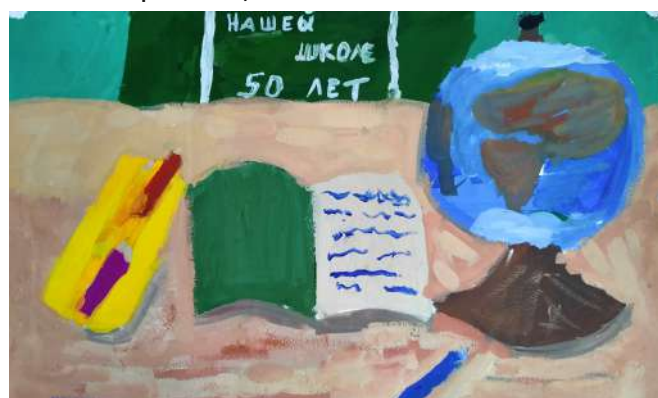
Устина Кучер, 3Б