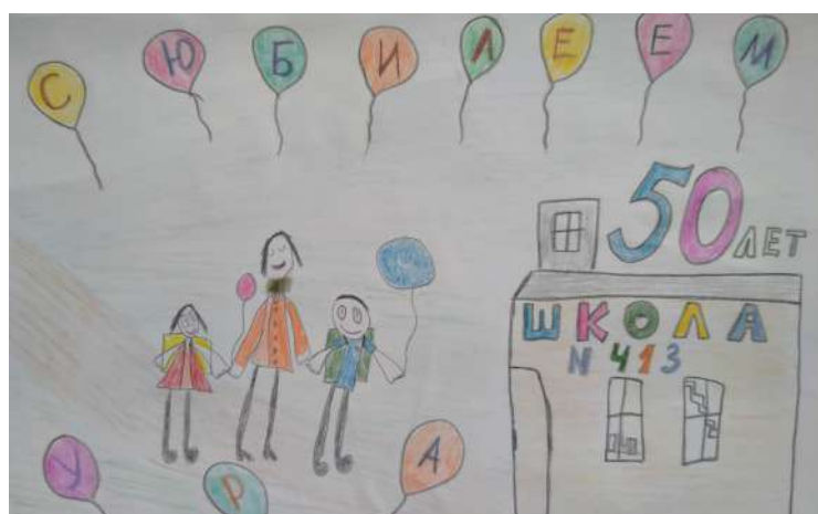
Леся Сергеева, 1Б