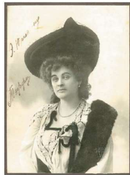
Н.А. Тэффи. Стрельна. 1910